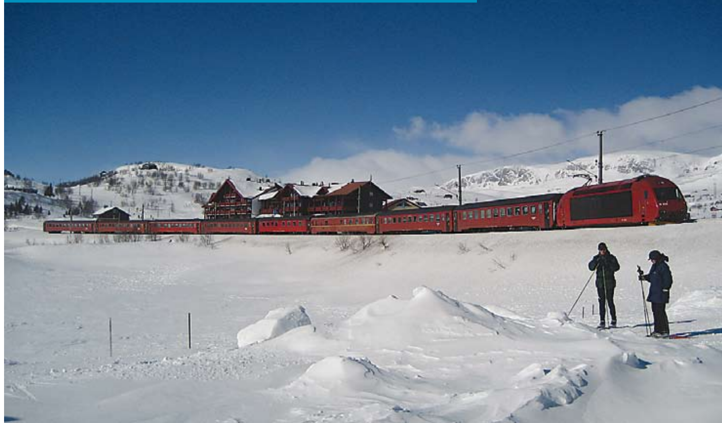
Bergensbanen nedanfor Hallingskarvet på Ustaøset.