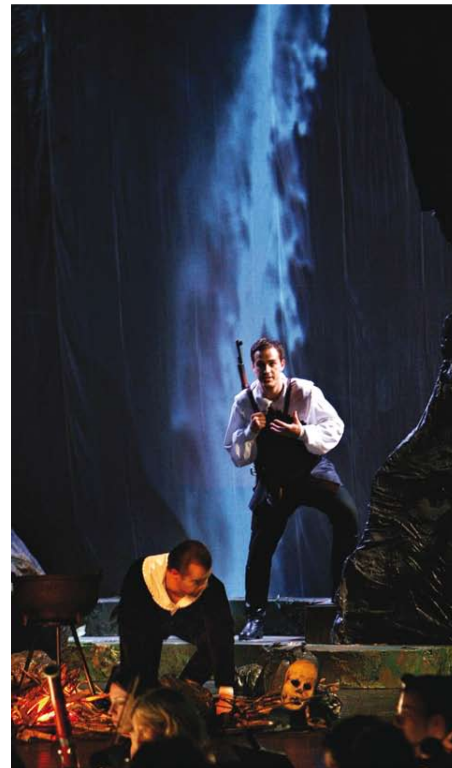
Kommunekreditt har vore støttespelar for Opera Nordfjord i ti år.