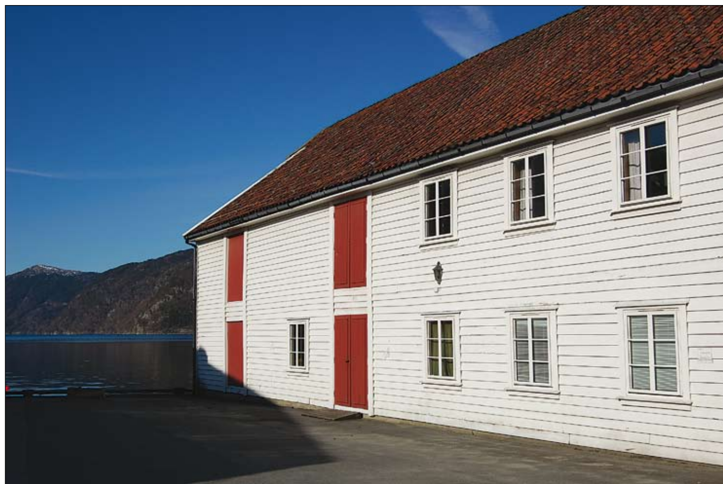
Rasmussensjøhuset på Sand kan bli nasjonalt senter for barnekultur.

- Ein må setje seg mål og arbeida fram mot desse. Det er realistisk å tenkja seg opning av senteret i 2011. Det føreset at alle partar drar lasset i lag og i same retning. Senteret er tenkt organisert som ein del av Ryfylkemuseet som sit på ein stor kompetanse og vil vere svært høveleg stad for utvikling av senteret. Barn og unge er også satsingsområde for museumspolitikken