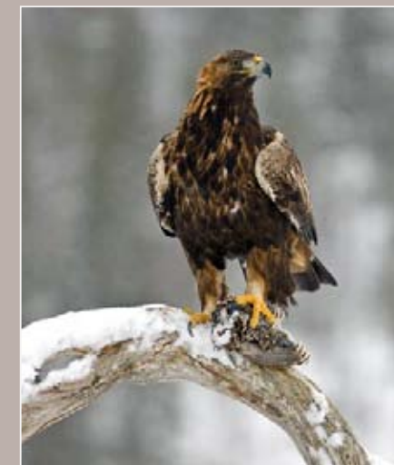
Kongeørn (Aquila chrysaetos)

Kongeørn hekkar i store delar av landet, også ute ved kysten. Den har tilhald i høgareliggende skog- og fjellstrøk, og den manglar i dei sørvestlege delene av landet. Kongeørn har i dag ein stabil bestand her i landet. Men den er sars var for naturinngrep og for å verta una ved reiset, og den er framleis utsett for faunakriminalitet. Kongeørn er rekna som "nær trua".