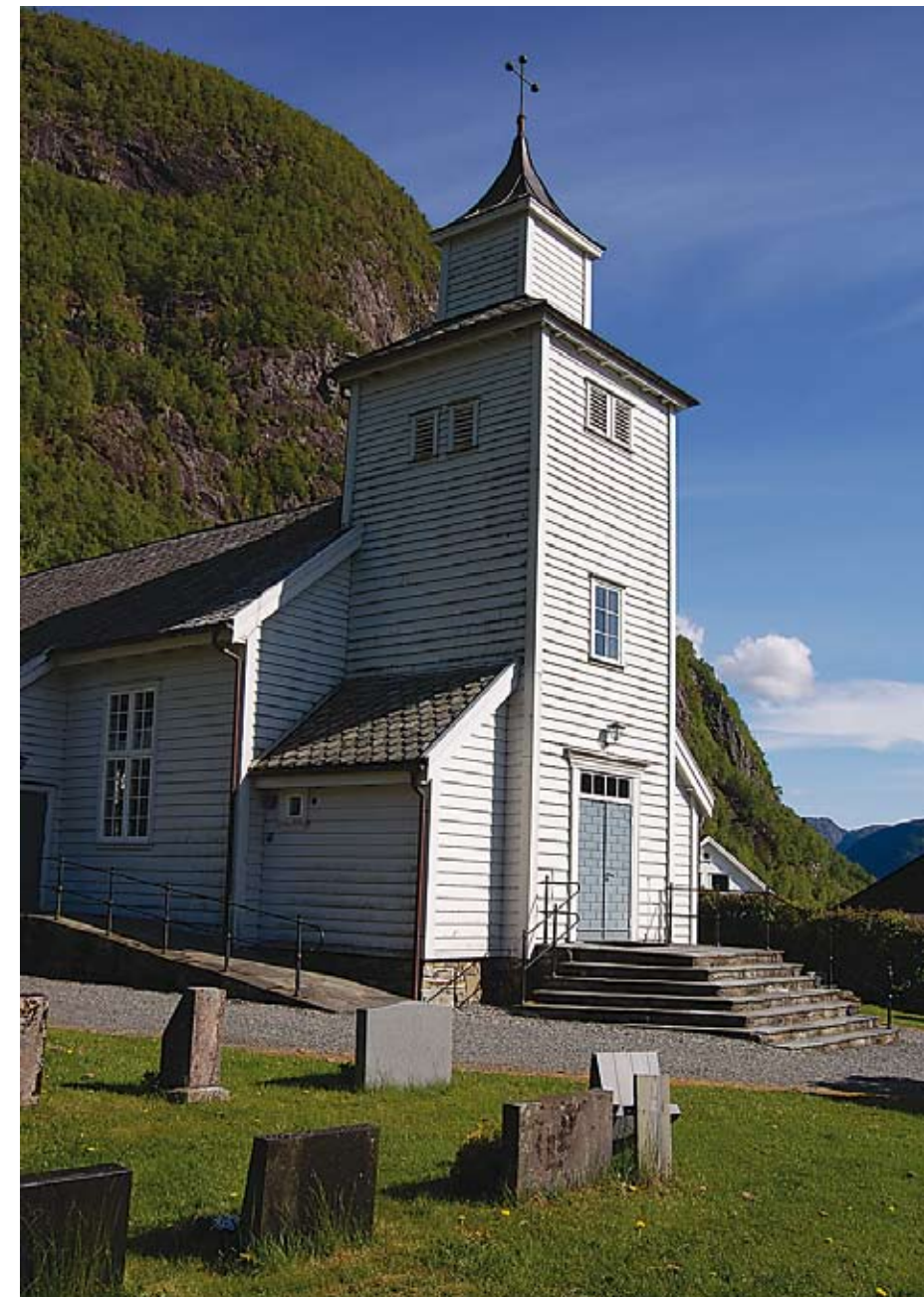
Illustrasjonsfoto: Erxfjord kyrkje

miljøfyrtårn og inviterte kommunen og næringslivet til informasjonsmøte. Det førte igjen til at både kommunen og fleire bedrifter no arbeider aktivt med dette.