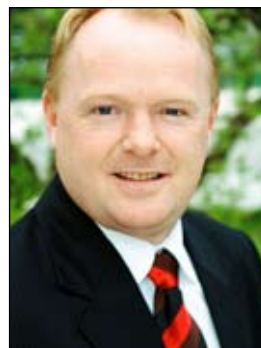
Leiar i Transport – og kommunikasjonskomiteen, Per Sandberg, meiner regjeringa satsar for lite på samferdsle.

- Infrastruktur og forskning kan til dømes auke produktiviteten i økonomien slik at me får meir ut av kvar arbeidstime. Midlar til kommunane sikrar blant anna sjukeheimsplasar slik at me alle kan få ein verdig alderdom. Barnehageplass til alle som ynskjer det kan gi barna ein