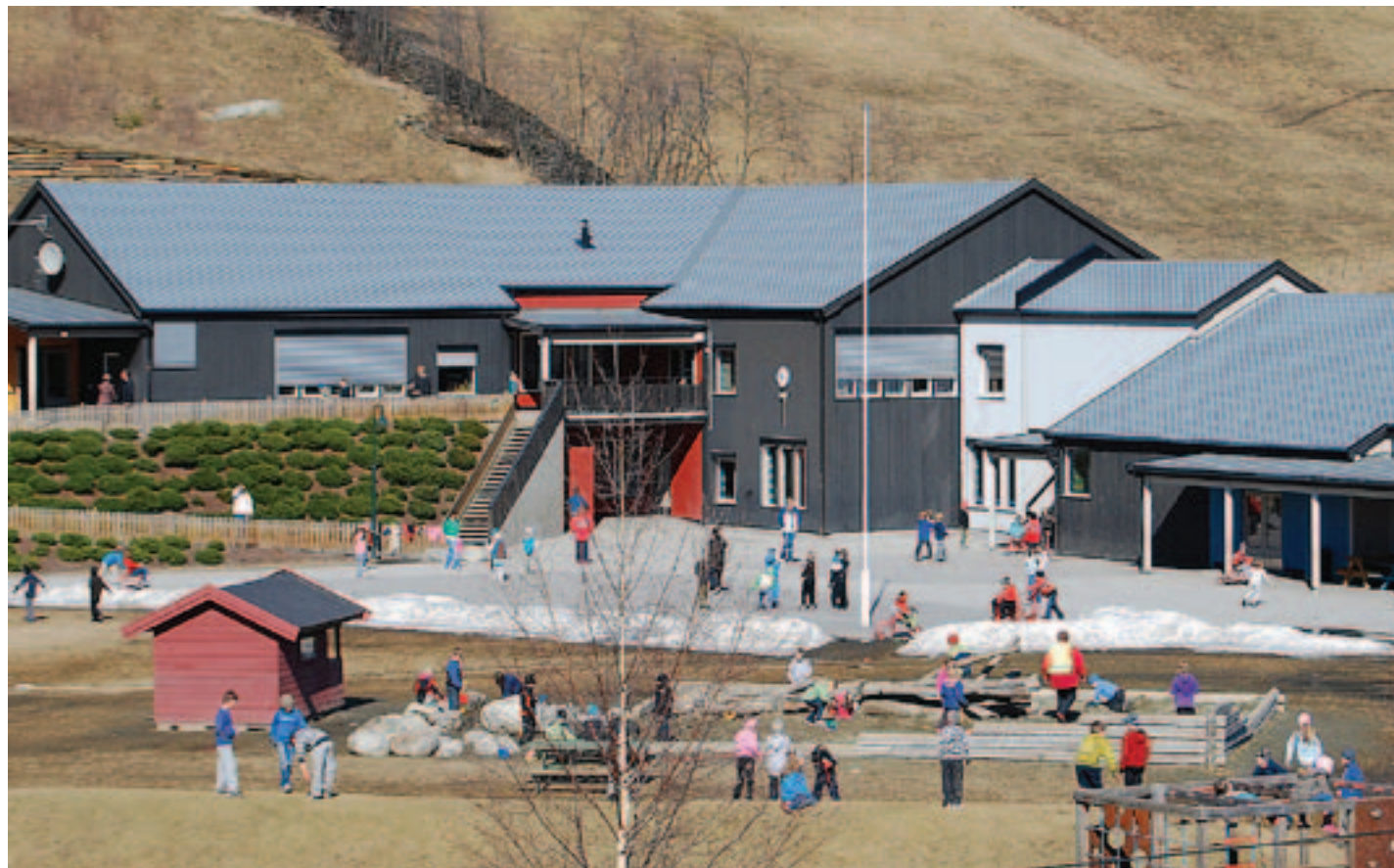
VIL HA ENDRING: Otta skole vurderer no å bli ein bokmålskule.

Ei rådgjevande folkerøysting om skulemål på Otta skole i Sel kommune resulterte i 103 røyster for bokmål og 76 for nynorsk. Skulen har nynorsk som hovudmålform i dag.