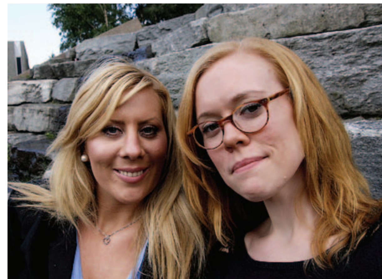
Elektroniske tavler. Bedrifta Soleis lagar programvare til elektroniske tavler. Programma kan brukast i grunnskule, i vidaregåande skule og i vaksenopplæringa.