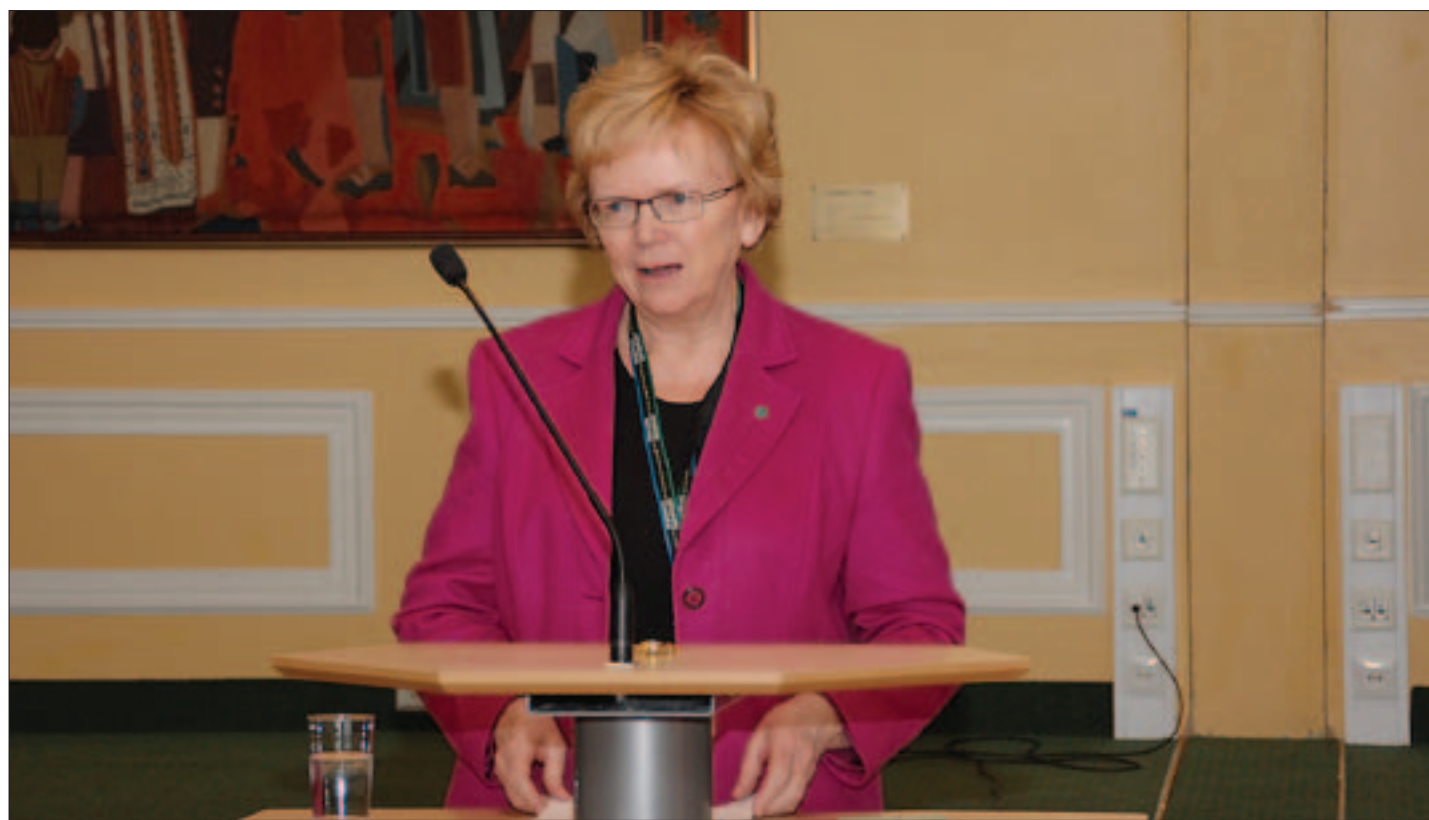
MÅ KJEMPE: Samferdsleminister Magnhild Meltveit Kleppa meiner kommunane og dei involverte i Diktarvegen langs rv. 13 må kome på bana i høve NTP. – Fristen for fylkeskommunane sin uttale er i april, minna ho om.

– Rute 13 er ei legendarisk vegrute med dikting og kulturelle opplevingar langs