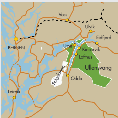
Illustrasjon: Gerbard Stoltz

Ullensvang vart i 1964 slått saman med Kinsarvik (unntate Kvanndal-området), Åsgrenda av Kvam og Eidfjord til ein ny storkommune. Eidfjord vart skild ut frå Ullensvang att i 1977.