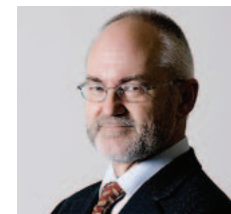
FREMST: Rektor ved Universitetet i Bergen, Sigmund Grønmo meiner oppgåva til Universitetet i Bergen er å stå i fremste rekke for å utvikle nynorsken.

– Mitt perspektiv er meir politikken i stort, kva krefter som vil styrkje eller byggje ned både nynorsk og dialektbruk. Nynorsken, som alle motkulturar, blir pressa av sentralisering og elitisme. Det er viktig å vere stolt, slår han fast.