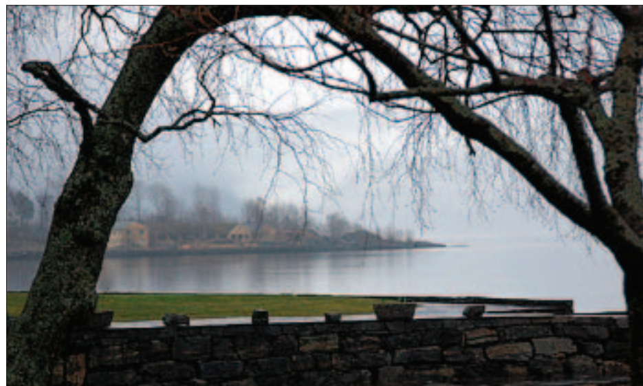
HERAD: Granvin, Kvam, Ulvik og Ullensvang er dei einaste kommunane i Noreg som brukar herad som nemning i staden for kommune.