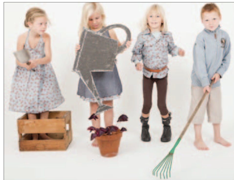
TO KOLLEKSJONAR: Ei historie kvart år frå Roald Kaldestad sin penn dekkjer to kleskolleksjonar.