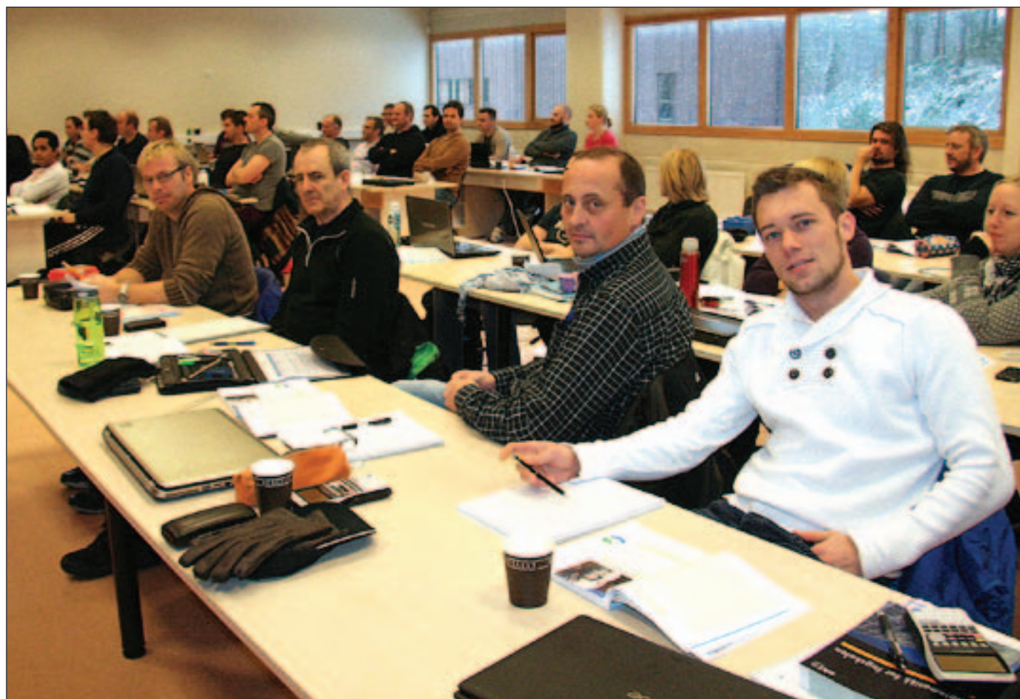
ANSVARLEGE:PÅ SKULEBENKEN: 35 tilsette frå fire ulike industribedrifter på Stord har fått plass på det toårige fagskuletilbodet bedriftene skipa til i haust.

– Neste steget er ingeniørutdanning ved Høgskolen i Bergen, med assistanse frå høgskulen i Haugesund. Her planlegg ein