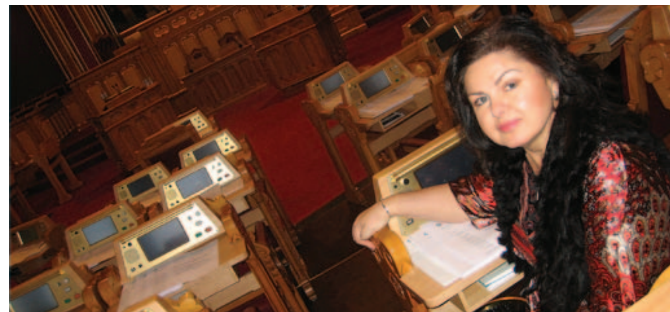
ATTRAKTIV: Stortingsrepresentant Laila Marie Reiertsen (Frp) meiner ein må gjere nynorsken meir attraktiv, samstundes som ein må leggje høva til rette slik at fleire vil og kan bruke nynorsk.

Reiertsen har sjølv opplevd fleire sidar ved å bruke nynorsk offentleg. – Når eg skriv innlegg til avisene på nynorsk, er det ofte ei eller fleire aviser