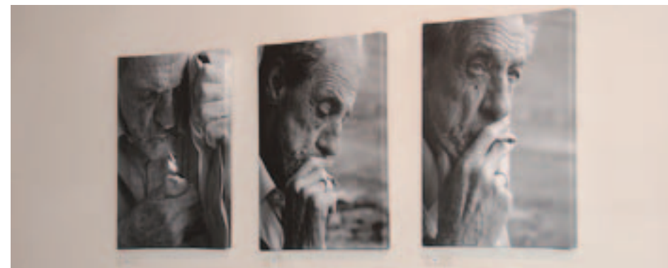
STILLER UT: Utstillingar av både lokal og regional kunst er ein del av tilbodet på Ekspedisjonen.