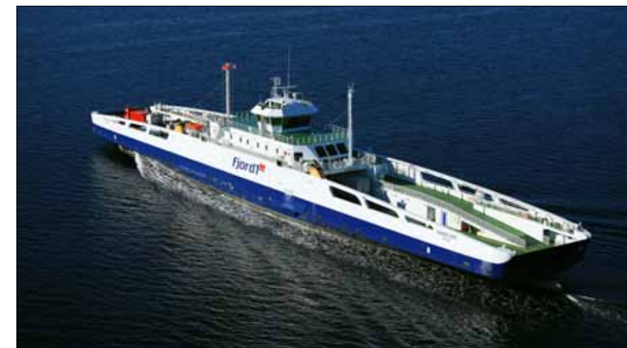
SATSAR PÅ MAT: Fjord I vil utbetre mattilbodet.

Resultatet av brukarundersøkinga blant ferjepassasjerane viste at dei ønskte meir sunn mat og mat som var enkel å ta med seg i bilen. Nå i sommar blei konseptet Ferdamat innført som eit prøveprosjekt på dei to Fjord I-ferjene «MF Fanafjord» i Halhjem-Sandvikvåg-sambandet i Hordaland og «MF