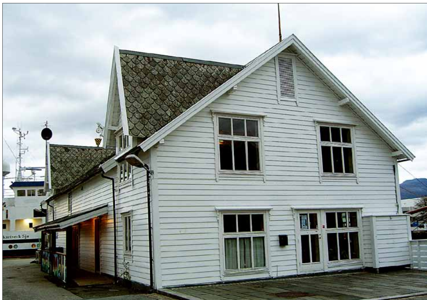
SAMLINGSSTAD: I 12 år har HAFFEN ungdomsbuss eksistert og er ein kjærkomen samlingsstad for ungdom i Flora kommune.

Haffen ligg midt i smørauga av sentrum, og det er ope for alle fire dagar i veka. Haffen rommar to bandrom, biljard- og møtelokale, eit stort diskotek, kjøken og kafé. Band, dansegrupper og ungdommens bystyre er faste brukarar av huset i tillegg til alle som stikk innom i løpet av dei fire kveldane i veka det er ope.