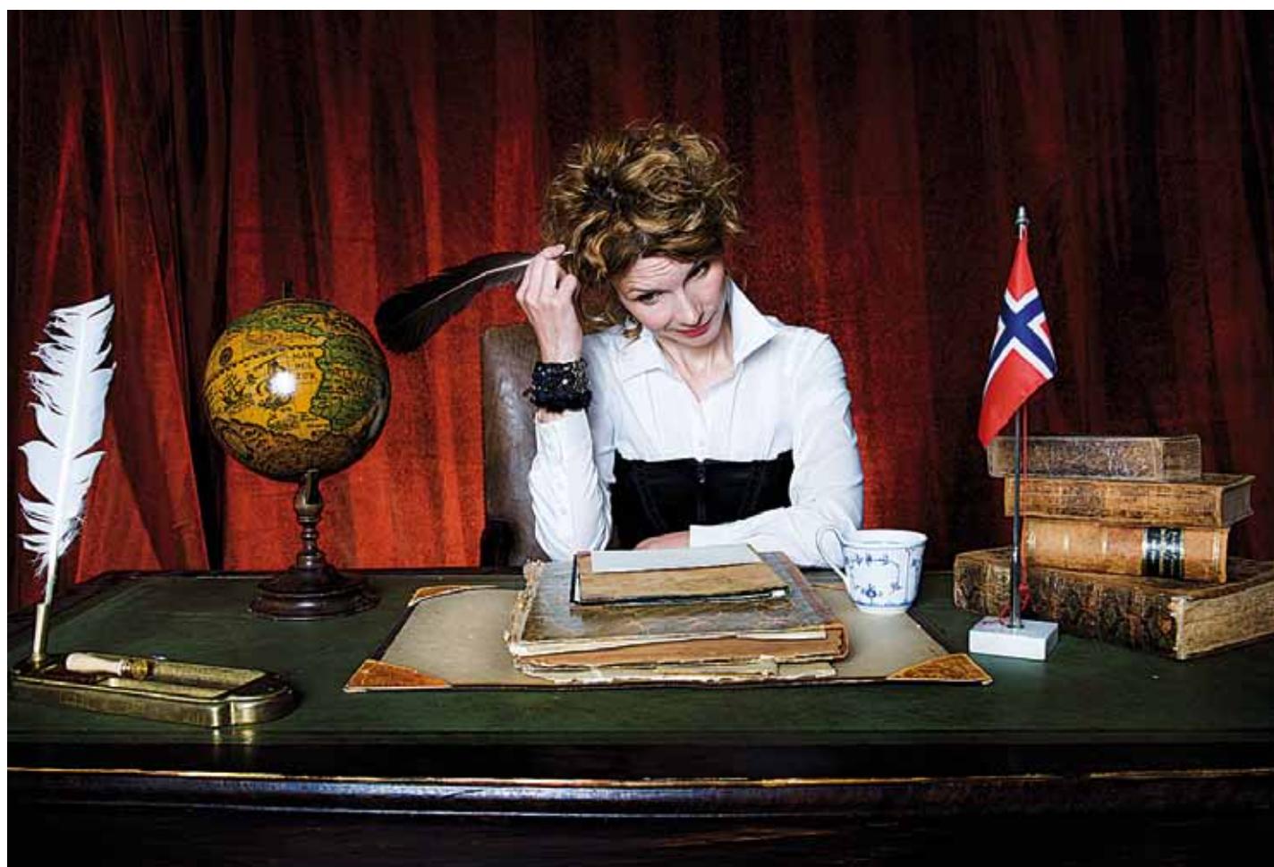
I OSLO: Kjære landsmenn går! går for tida på Det Norske Teatret.