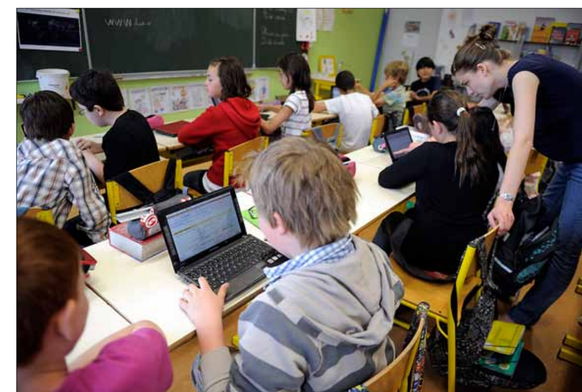
PÅ SKULEN: Dei fleste asylsøkjjarar får den opplæringa dei har krav på.

Når det gjeld vidaregåande opplæring, er det store skilnader. – Mottaks- og omsorgssenterstilsette som blei intervjuet, fortalde at skuletilbodet til asylsøkjjarar i vidaregåande opplæring varierer mykje mellom fylka, og at det kan skape problem for mange unge når dei flyttar frå mottak til bustadkommune, seier Sletten.