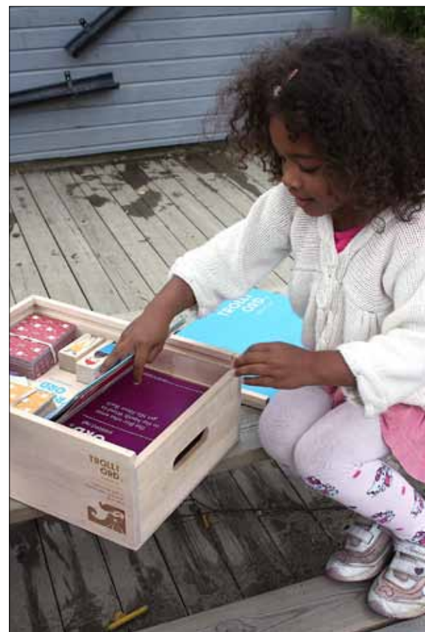
GLADE BARN: Barna set tydeleg pris på å leike med Troll i ord.