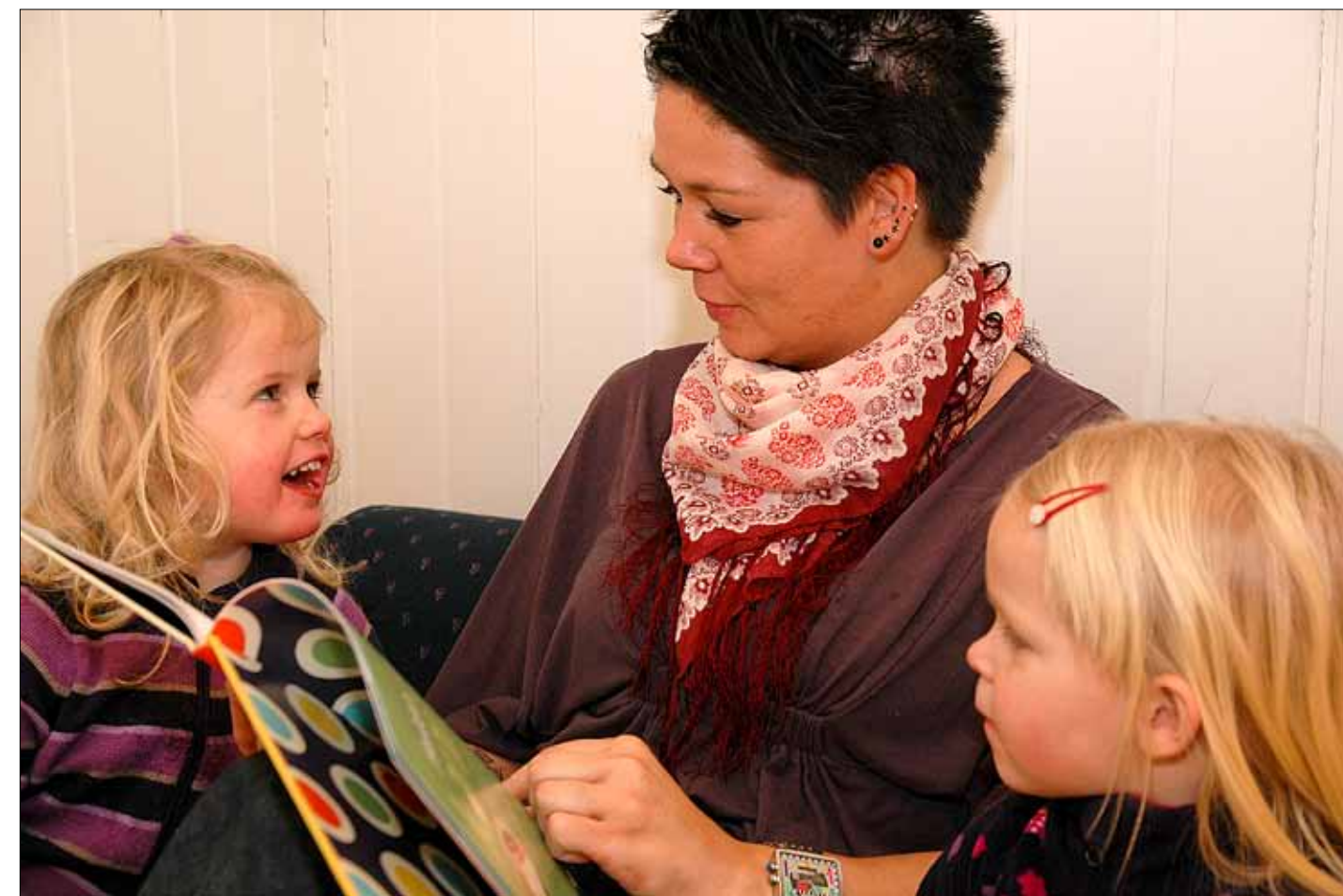
NY: Barne- og ungdomslitteraturen får ein eigen Nordisk råds litteraturpris.