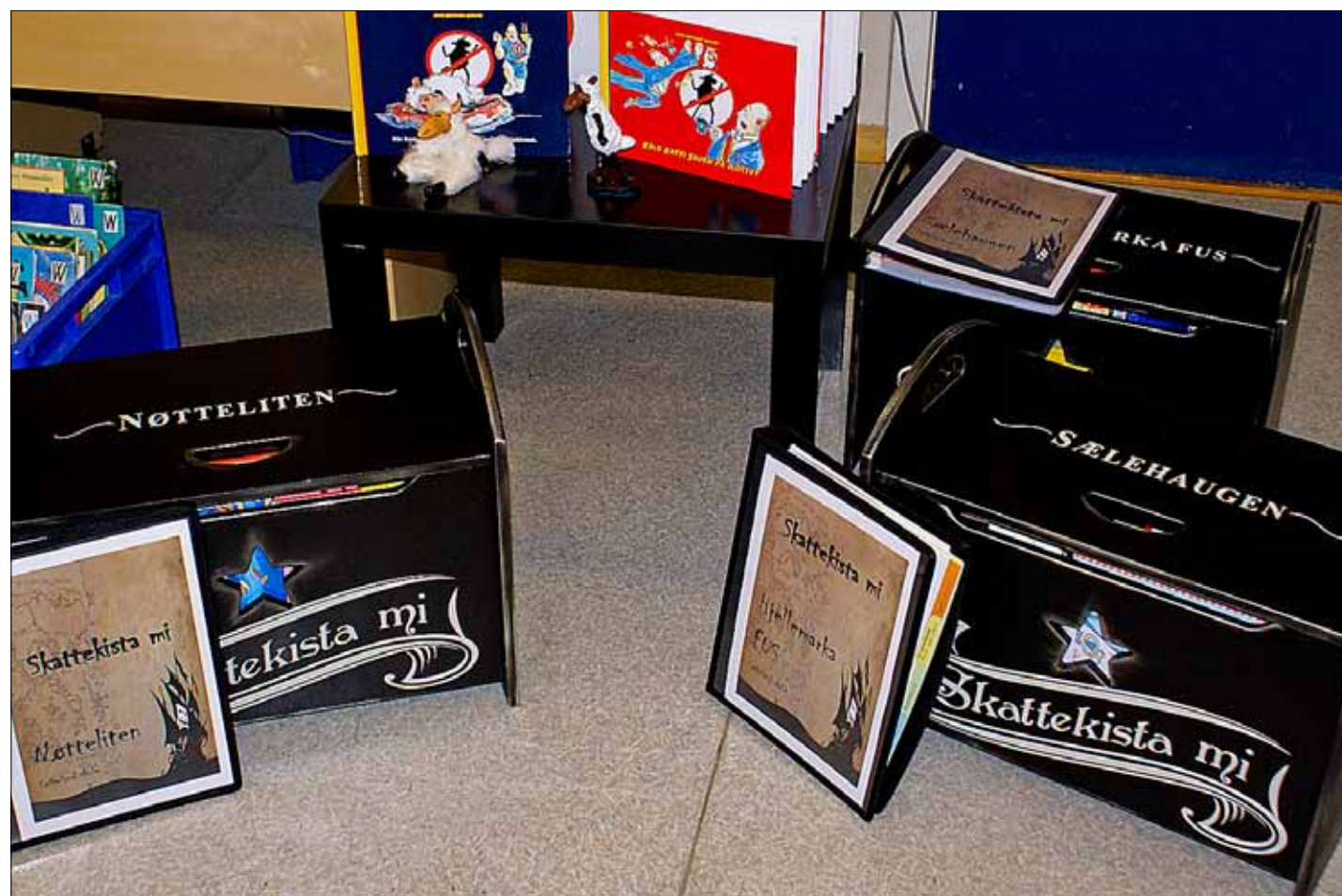
NYNORSKE BOKSKATTAR: Tre femårsgrupper i barnehagar i Os kommune har nyleg fått utlevert ei skattekiste med nynorske barneboeker og ressurshefte, som del av eit språkleg samarbeidsprosjekt mellom Søfteland skule og barnehagane i kommunen.

– Det skal ikkje så mykje til for å få born i barnehagen og småskulen til å bli tryggare på det nynorske skriftspråket, seier Elisabeth Djuvik Hanstvedt.