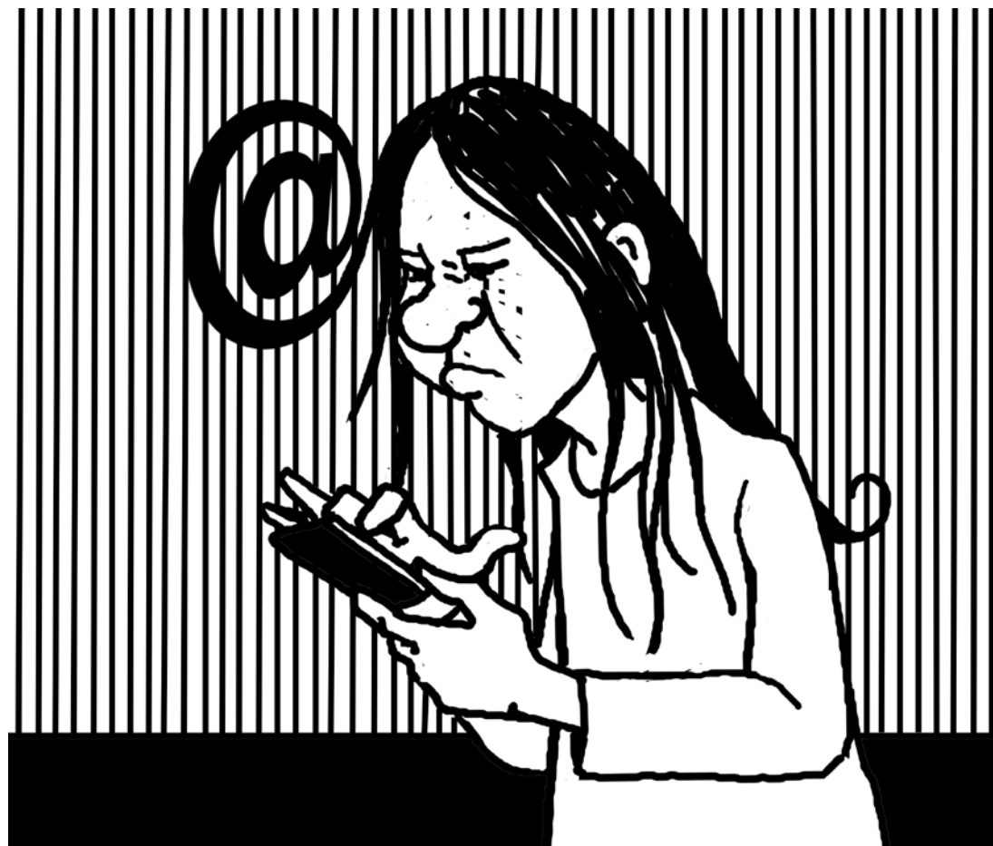
Illustrasjon: Leif Harald Forthun