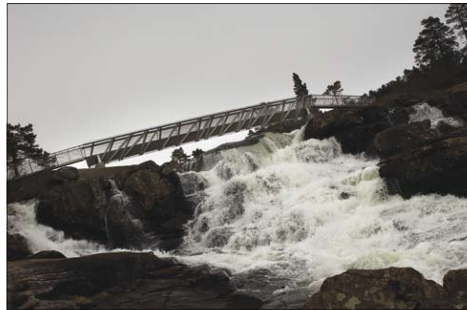
Rv 13 byr på mange opplevingar. Her frå Fosseheimen på Gaularfjellet.

- For eit literatursenter i emning er det sjølvstavgav storverdi å verta med i eitslikt