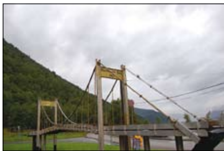
Eidfjord er ein av kommunane som har høg etableringsfrekvens