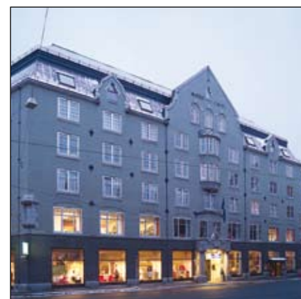
Avtale med Bondeheimen gjev LNK-medlemmer rimelegare overnatting i Oslo

JUDITH SØRHHUS LITLHAMAR judith@norsk-plan.no