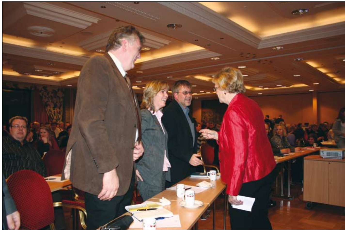
Kommunalminister Magnhild Melteit Kleppa fekk mange innspel til distrikts- og regionalmeldinga på ope folkemøte på Lofthus i Hardanger.