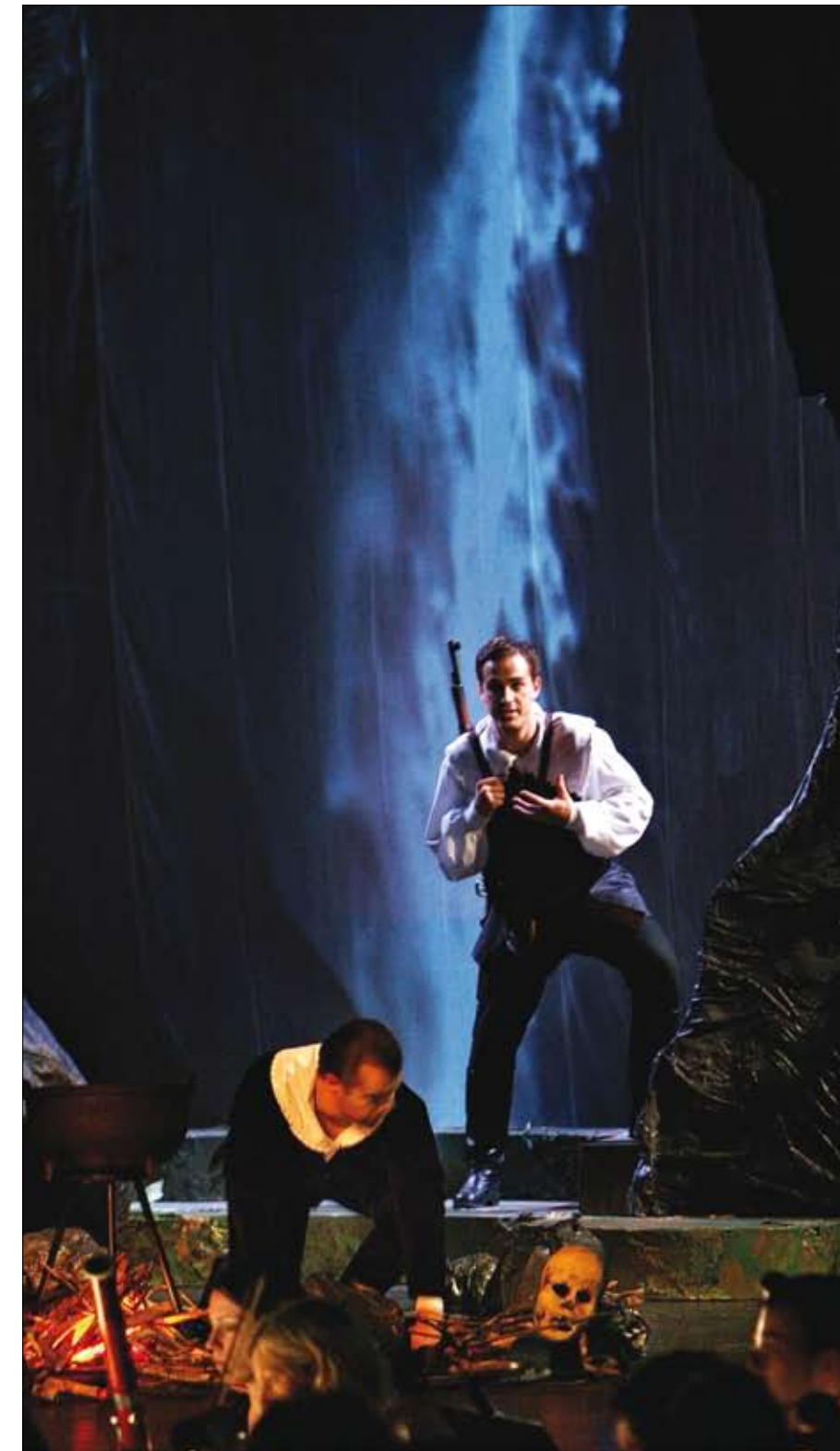
Kommunekreditt har vore støttespelar for Opera Nordfjord i ti år.

Kjerringgarden er del av ei nettverkskredittgruppe saman med mellom andre galleri å godt i Sandeid og Bøker og Sånn i Etne kommune. Gruppen som vart etablert i 2001 har mottatt 200.000 i midlar frå Innovasjon Norge, som medlemene disponerer innad i gruppa. Kreditten er meint som ei støtte til småtablerarar, og gruppa avgjer sjølv renta for utlån. - Nettverksgruppa er eit samlingspunkt, der idear kan drøftast og ein kan dela erfaringar på godt og vondt - seier Johannesen.