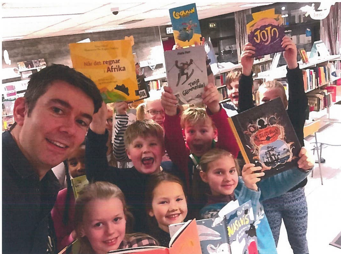
Barn og unge over heile landet har kome med forslag til kva som er dei beste nynorske barnebøkene.